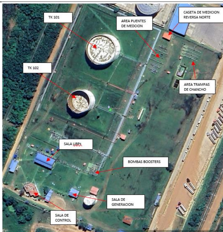
Figura 1. Estación Terminal Santa Cruz

Coordenadas: Latitud: 17°52'43.78". Longitud: 63°11'44.98"